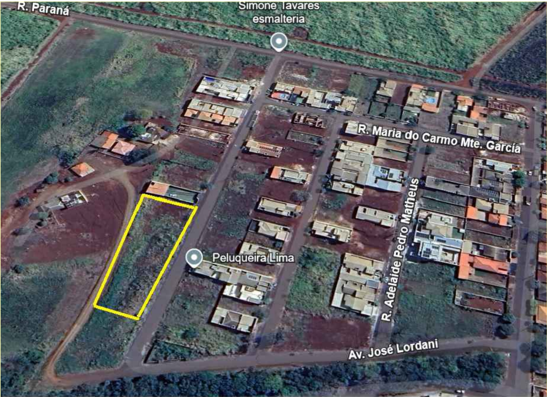
Local da obra - Imagem google SEM ESCALA